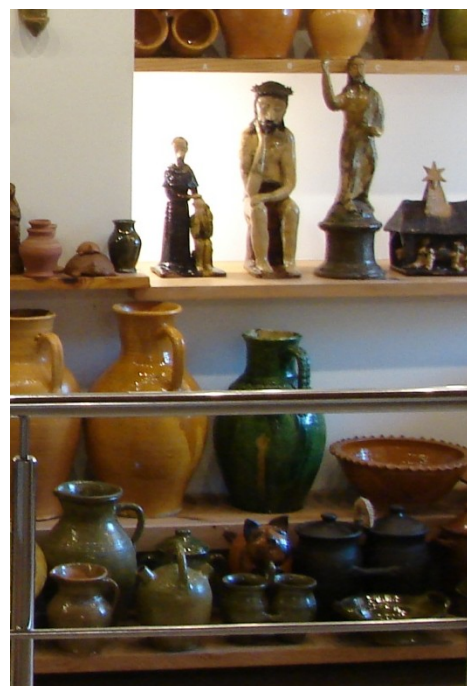
Piec garncarski i miejscowe wyroby ceramiczne w ośrodku Tradycji Garncarstwa w Chałupkach.