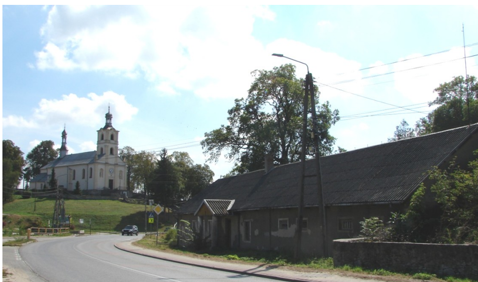
Kościół i stara plebania w Brzezinach.

Nieodłącznym elementem krajobrazu są zabytki sakralne: zespoły kościelne, kaplice i kapliczki przydrożne, figury i krzyże przydrożne. Na terenie gminy Morawica znajdują się dwa zespoły sakralne wpisane do rejestru zabytków: w Lisowie i Brzezinach. Obydwie parafie mają średniowieczną metrykę, natomiast murowane kościoły zostały wybudowane w XVII wieku w stylu barokowym, na miejscu gotyckich kościołów drewnianych. Obydwa znajdują się na widocznym wzniesieniu, górując nad okolicą. Kościół w Lisowie został wzniesiony przez właścicieli Lisowa - ród Duninów oraz doposażony przez kolejnych właścicieli – Krasieńskich, którzy przeznaczili do budowy do niego kaplicę św. Barbary na swoje mauzoleum. W XIX wieku w krajobrazie pojawiają się kaplice – w Nidzie p.w. Nawiedzenia NMP (drewniana, kryta gontem z sygnaturką, z mensą i ołtarzem, w którym znajduje się obraz Matki Bożej) oraz podobna, murowana w Brudzowie. Wewnątrz również znajduje się mensa z nastawą ołtarzową, a w szczycie dachu sygnaturka. Obie kaplice pełniły prawdopodobnie funkcję wyjazdowych kaplic, które umożliwiały odprawianie mszy św. w miejscowościach bez kościoła. Podobną funkcję pełniła dworska kaplica Oraczevskich w Morawicy, która obecnie znajduje się w trwałej ruinie i jest częścią tzw. Kalwarii Świętokrzyskiej - współczesnego krajobrazu kulturowego.