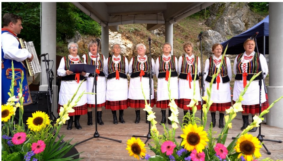
Zespół Brzeziniarki na występach w trakcie trwania festynu „Chałupkowe Garcynki” (fot. https://www.morawica.pl ).

Na terenie gminy działa Ośrodek Tradycji Garncarstwa w Chałupkach, chroniący od zapomnienia ginący zawód garncarza. W dawnej zagrodzie garncarskiej należącej do rodziny Głuszków udostępniono do zwiedzania piec oraz warsztat garncarza, a także salę ekspozycyjną z różnorodnymi wyrobami garncarskimi. Co wyjątkowe piec umieszczony był wewnątrz budynku. W pobliżu wybudowano drewniany dom w tradycyjnym stylu, w którym odbywają się zajęcia edukacyjne. Co roku Gmina Morawica organizuje festyn folklorystyczny „Chałupkowe Garcynki”, promujący lokalnych twórców ludowych.