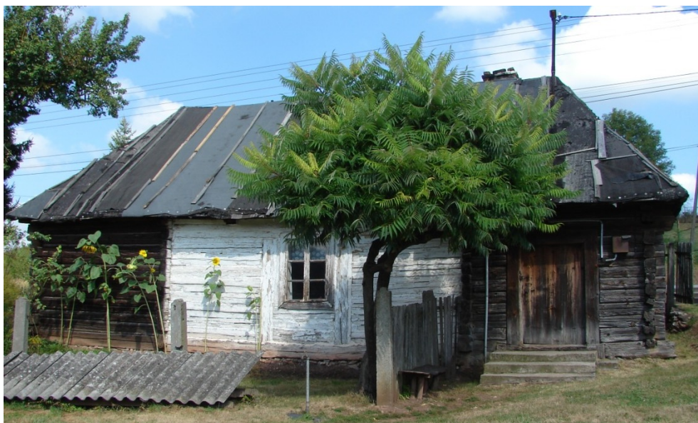
Drewniana chałupa z końca XIX wieku w Brzezinach (ujęta w Gminnej Ewidencji Zabytków).

Kolejnym elementem krajobrazu kulturowego są zespoły dworsko-parkowe, które znajdują się w Drochowie Dolnym (dwór w ruinie, park ze stawami i ogrodzenie), Dębskiej Woli (dobrze utrzymany park, przebudowany dwór na szkołę), park w Morawicy, pozostałość budynków folwarcznych w Obicach. W miejscowościach takich jak Zaborze, Lisów, Radomice o dawnych założeniach świadczy jedynie nazwa ulicy – Dworska, Stara Wieś, Dwór.