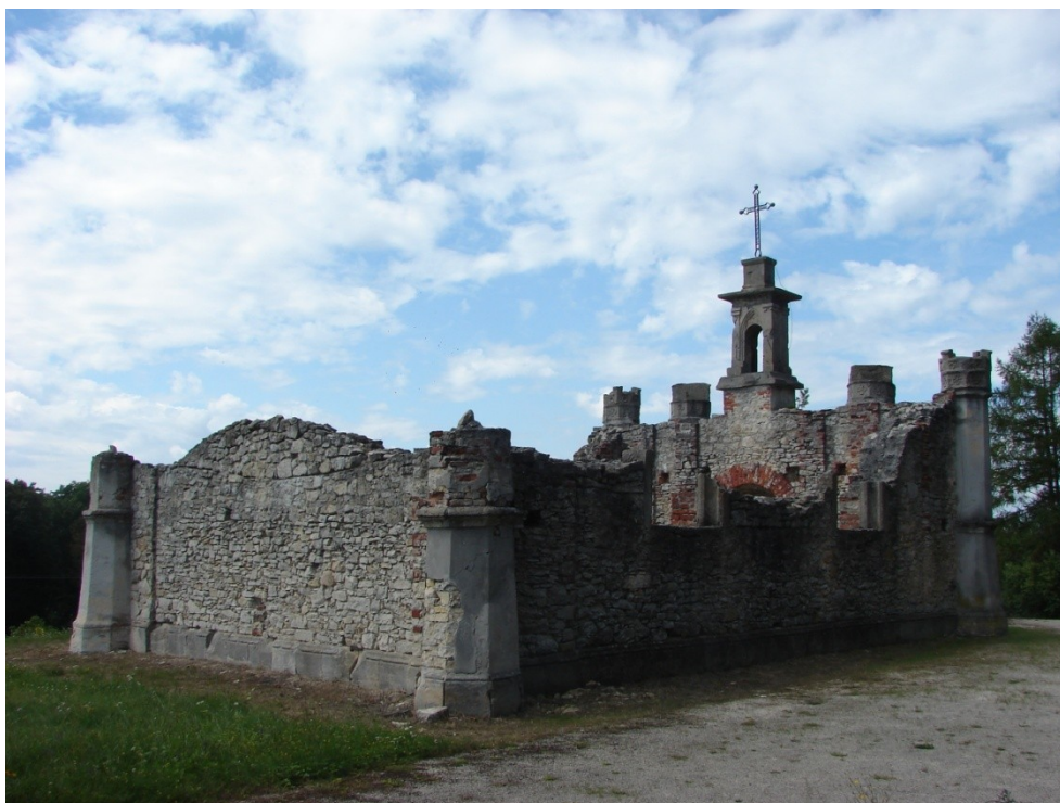
Kaplica Oraczewskich w Morawicy