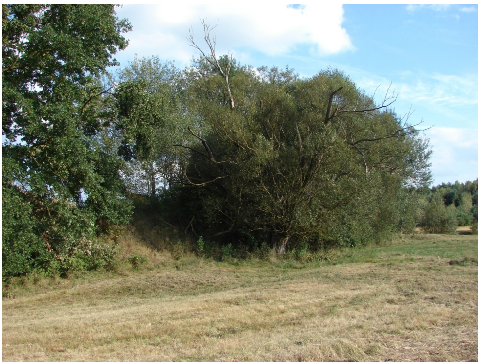
Stanowisko archeologiczne 14/45 w Zbrzy (gródek stożkowaty?, dwór typu motte?), widok od północy.

Na terenie gminy Morawica nie ma stanowisk archeologicznych wpisanych do rejestru zabytków. Spis stanowisk archeologicznych ujętych w Gminnej Ewidencji Zabytków Gminy Morawica znajduje się w załączniku nr 2.