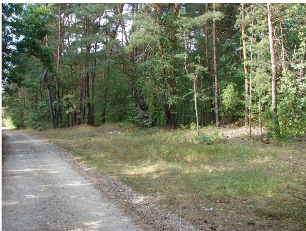
Stanowisko archeologiczne 5/67 w Nidzie (gródek stożkowaty?, cmentarzysko kurhanowe?), widok od południowego wschodu.

Ruchome zabytki archeologiczne znajdują się między innymi w Muzeum Narodowym w Kielcach i Muzeum Archeologicznym w Krakowie.