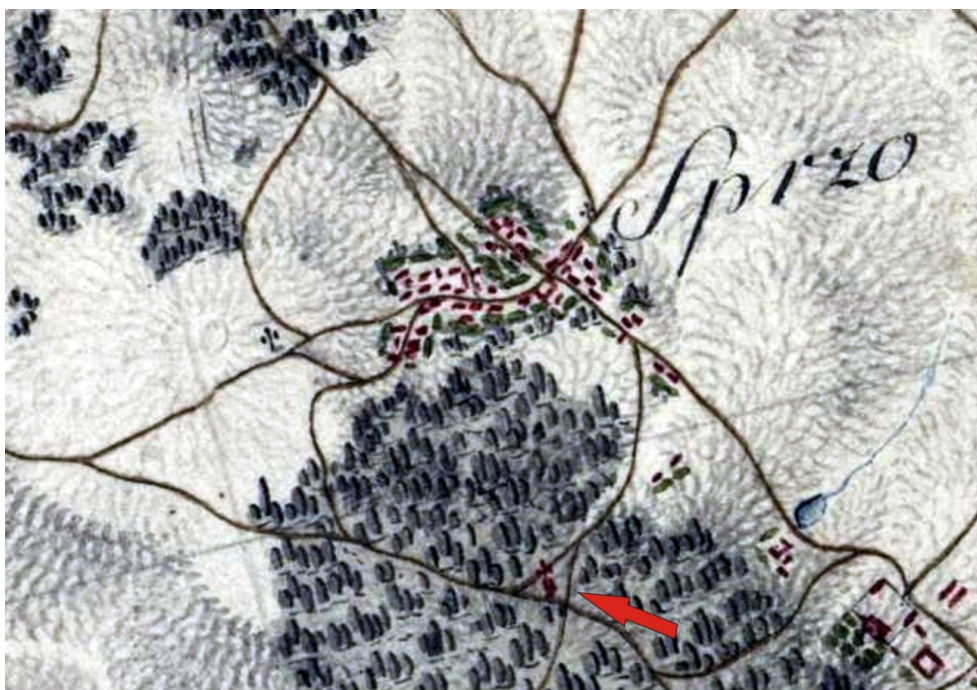
Zbrza na mapie Galicji zachodniej z lat 1801-1804 z zaznaczoną kapliczką św. Tekli na szczycie Baraniej Góry.

Widoczne są nadal układy zabudowy wsi typu ulicówka: Drochów Górny, Drochów Dolny (ul. Wspólna i Ogrodowa, na końcu której zachowany jest zespół dworsko-parkowy, zamykający od zachodu zabudowania miejscowości). Podobny układ ma Dębska Wola z ulicą Szlachecką i dawnym zespołem dworsko - parkowym. Wsią ulicówką były i są nadal czytelne w zabudowie - Brzeziny – ul. Chęcińska, z zachowanymi jeszcze dość licznie drewnianymi domami, zespołem kościelnym w części środkowej. Ciekawymi w swoim rozplanowaniu zabudowy jest wieś Zbrza i Chałupki, w swoim kształcie oddające ukształtowanie terenu i warunki naturalne. Zbrza ulokowana u stóp Baraniej Góry, jest wielodrożnicą z najstarszymi ulicami: Starą, Górą, Wąwóz, św. Tekli prowadzącą na szczyt wzniesienia, na którym znajduje się kapliczka św. Tekli. Sama nazwa miejscowości jest nazwą bardzo archaiczną. W dokumentach średniowiecznych występuje pod nazwą Debrz, Debrza, Dbrza, co oznacza wypływ wody, źródłisko (stąd też nazwa Dębska Wola, w średniowiecznych dokumentach występująca jako Debrzka Wola).