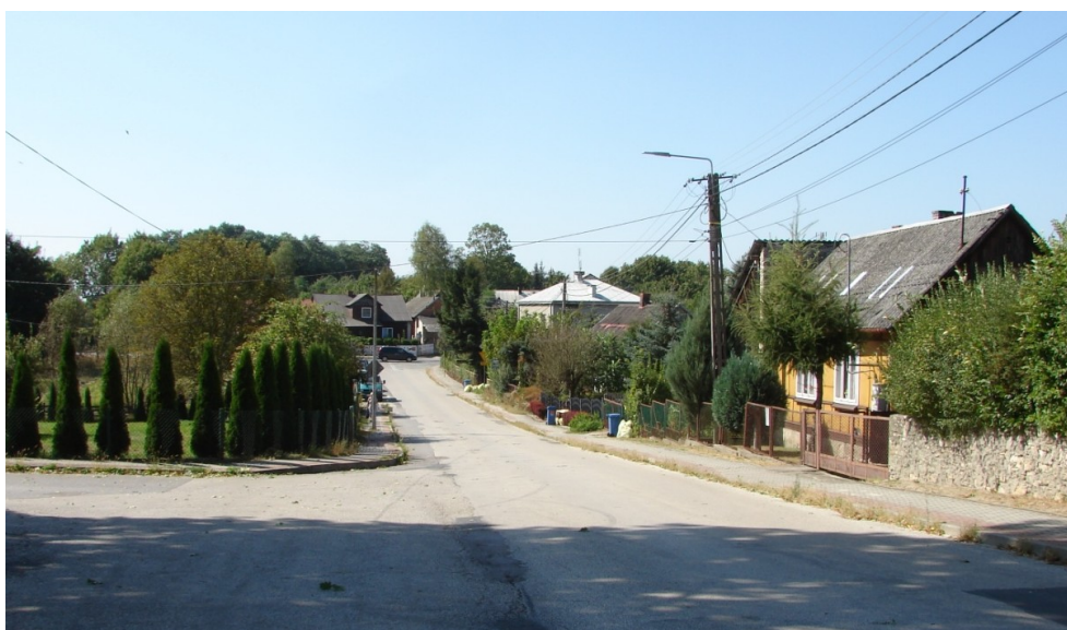
Ul. Kościelna w Lisowie.

Krajobraz kulturowy w gminie Morawica zdominowany jest przez współczesne przekształcenia w postaci usytuowania kopalń (kamienia, gliny), zakładów przemysłowych, budowy nowych dróg, poszerzania starych ciągów komunikacyjnych. Szczególnie jest to widoczne w północnej części gminy, która stała się również „sypialnią” Kielc (Bilcza, Radomice, Morawica, Nida). Południowa część bardziej zachowała dawny wiejski i dworski krajobraz w postaci utrwalonego układu dróg (Lisów, częściowo Chałupki, Dębska Wola, Zbrza, Drochów Dolny, Zaborze, Brudzów). Co charakterystyczne większość wsi ma charakter zabudowy skupiony (wieś wielodrożnica lub okolnica). Do dziś widoczne jest to w miejscowościach: Zaborze (ulice Dworska, Leśna, Spacerowa), Chmielowice (ul. Okrężna, Spacerowa i Szkolna), Lisów (część ulicy Kieleckiej, Kościelna, Gliniana, Szkolna, wraz z drogami wyprowadzającymi z miejscowości: Cicha, Dworska, Spacerowa).