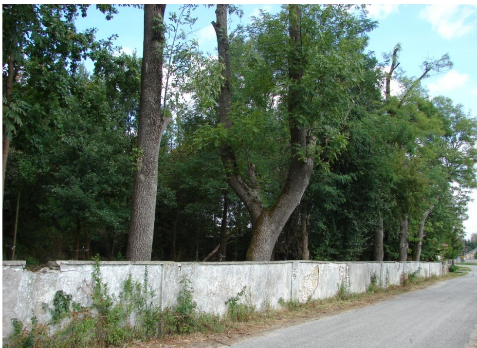
Park z ogrodzeniem w Drochowie Dolnym.

Kolejnym elementem krajobrazu kulturowego są zespoły dworsko-parkowe, które znajdują się w Drochowie Dolnym (dwór w ruinie, park ze stawami i ogrodzenie), Dębskiej Woli (dobrze utrzymany park, przebudowany dwór na szkołę), park w Morawicy, pozostałość budynków folwarcznych w Obicach. W miejscowościach takich jak Zaborze, Lisów, Radomice o dawnych założeniach świadczy jedynie nazwa ulicy – Dworska, Stara Wieś, Dwór.