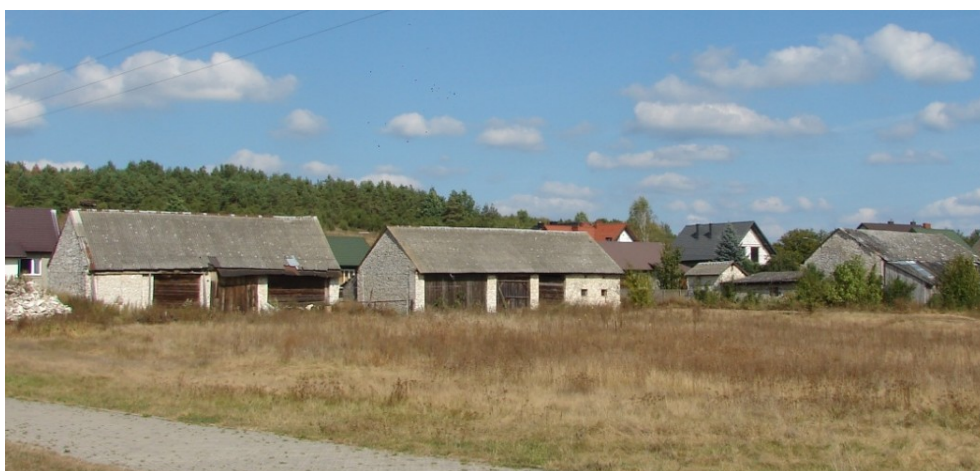
Murowane stodoły w Nidzie.

Na dawną zabudowę tych miejscowości składają się zazwyczaj drewniane domy, często z murowaną z kamienia ścianą szczytową, budowane na planie prostokąta, z dwuspadowym dachem, szalowane deskami nabijanymi w różnych kierunkach (malowanymi na kolor brązowy i zielony), z dekoracją snycerską pod okapem, usytuowane zazwyczaj frontem do drogi. Charakterystyczne są murowane z kamienia stodoły w konstrukcji mieszanej (pełne ściany szczytowe, dłuższe ściany - słupowe, między słupami deskowanie), murowane obory, kamienne piwniczki ziemne, często kamienne, murowane ogrodzenia. Z racji dostępności różnych rodzajów skał również znaczniejsze budowle jak dwory, karczmy, plebanie, młyny były murowane. W przeszłości młyny znajdowały się praktycznie w każdej miejscowości. Do naszych czasów dotrwały dwa murowane młyny w Bieleckich Młynach oraz Morawicy. W krajobrazie zaznaczają się również wapienniki zachowane w Chałupkach (ujęty w Gminnej Ewidencji Zabytków) oraz w Dębskiej Woli.