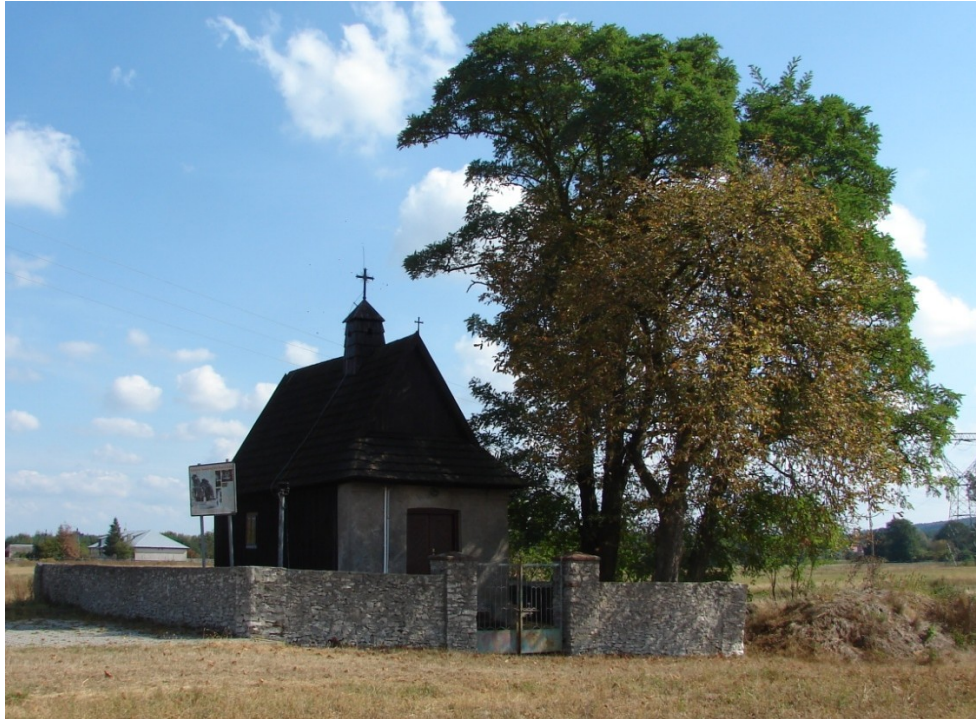
Kaplica Nawiedzenia NMP w Nidzie.