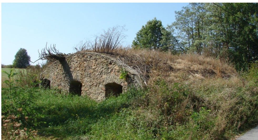
Murowana piwnica ziemna w Zaborzu (prawdopodobnie pozostałość zespołu folwarcznego).